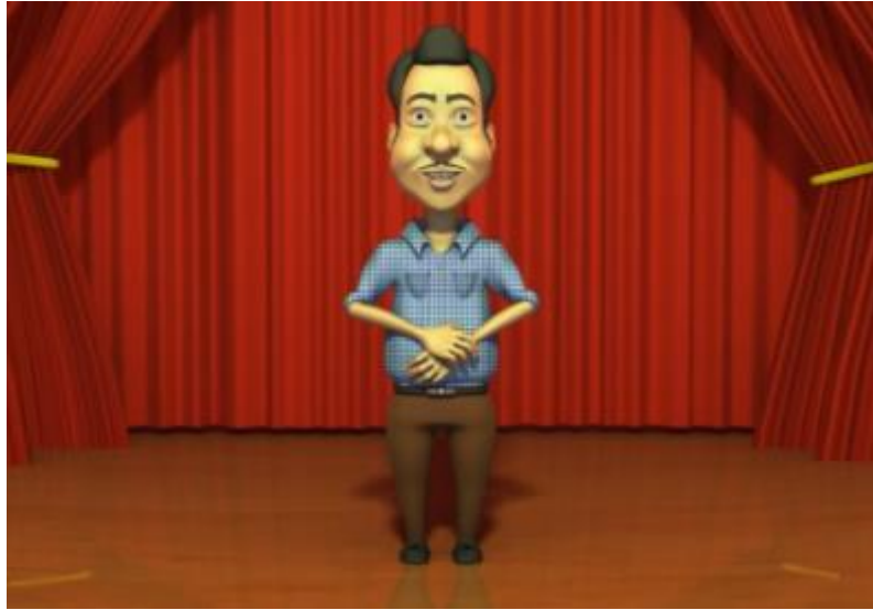
Rajah 3: Reka bentuk karakter Ramlee 3 dimensi.