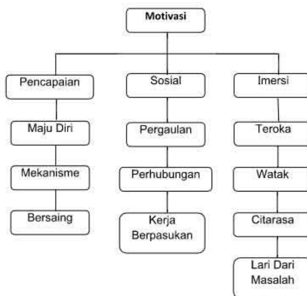
Rangka kerja penyelidikan

Motivasi pencapaian melibatkan keinginan seseorang untuk mendapat kuasa, maju dengan pantas dan berkumpul dalam permainan. Status motivasi juga dikaitkan dengan sosial untuk membentuk bermakna jangka panjang seperti hubungan dengan pemain lain, memperoleh kepuasan daripada menyertai usaha-usaha kumpulan dalam permainan, dan keinginan untuk membantu atau berbual dengan pemain lain dalam permainan. Akhirnya, motivasi Imersi terdiri daripada peranan bermain dengan pemain lain, menyesuaikan penampilan watak seseorang itu, mencari dan mengetahui perkara-perkara mengenai permainan. Di dalam kajian Yee (2006) mengenai ' Motivations for Play in Online Games ' analisis kajian berpandu kepada 10 sub komponen motivasi yang dikumpulkan ke dalam 3 komponen paling utama (Pencapaian, Sosial, dan Penyerapan). Jadual di bawah menunjukkan Hubungan antara motivasi dan demografi pembolehubah (umur, jantina, dan corak penggunaan) Kajian ini melihat melibatsama hubungan pemain permainan digital dalam di media baru. Penekanan kajian lebih menjurus kepada genre penyertaan khasnya bagi kumpulan melepak, meneroka dan gek dalam hubungannya dengan komponen-komponen amalan motivasi pemain. Bentuk rangka kerja kajian dapat dilihat seperti rajah dibawah.