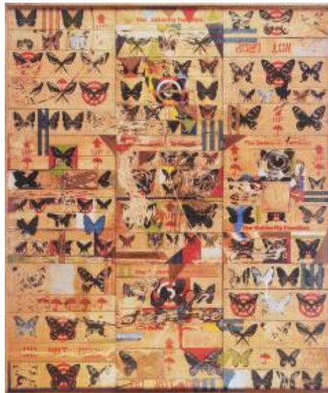
Gambar 1.4 : Ahmad Shukri Mohamed. Target Series – 'Camoufladge 1'. 1994. Media Campuran. 183 x 153 cm