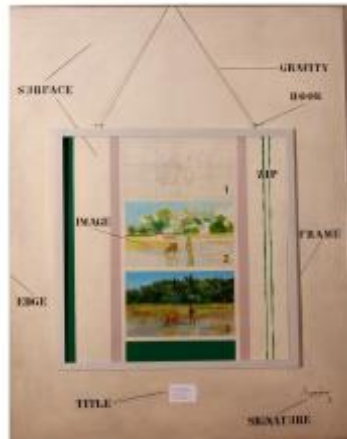
Gambar 1.3: Redza Piyadasa. Pemandangan Malaysia Teragung. 1972. Media campuran. 228cm x 177cm.

saya rasa, apa yang lebih dipentingkan disini adalah sifat fizikaliti bahan itu sahaja daripada idea yang ada pada karya itu (satu lagi ekspressionisme).