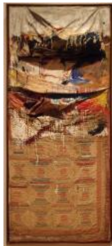
Gambar 1.2 : Robert Raushenberg. Bed . 1955. Media campuran. 191 x 80 x 23 cm

Karya-karya media campuran memanjangkan mesej yang cuba diungkapkan, yang mungkin terbatas akibat dikongkong penggunaan satu medium semata-mata. Media campuran berupaya mempertingkatkan tatabahasa visual pelukis dan dalam masa yang sama memudahkan tugas komunikasi karya-karya seninya. Penggunaan media campuran yang lebih dramatik kemudiannya dapat dilihat dalam karya-karya 'assemblage' atau 'combined painting' Rauschenberg (Mulyadi Mahamood, 23:1994)