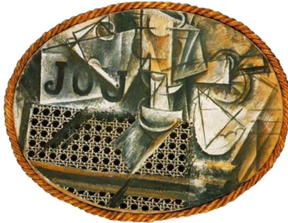
Gambar 1.1 : Pablo Picasso. Still Life With Chair-Caning . 1912. Media campuran. 29 x 37 cm

Percubaan ini telah dibuktikan oleh Pablo Picasso, melalui karya Still Life With Chair-Caning (1912) (Gambar 2.1). Ketika itu karya catan media campuran diilhamkan daripada melalui pendekatan seni eksperimentasi terhadap bahan. Alam benda menjadi subjek utama, menerusi penampalan keratan-keratan kertas akhbar dan majalah ke atas kanvas atau panel.