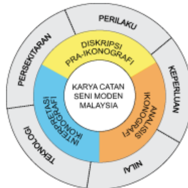
Rajah 1.1: Kerangka konsep adaptasi gabungan daripada konsep-konsep apresiasi seni oleh Panofsky E. (1972) dan institusi sosial oleh Turner J.H. (1988).

Kaedah teoritikal yang digunakan untuk mengkaji masalah dalam penyelidikan ini adalah melalui pendekatan interdisiplin (inter-disciplinary approach). Pendekatan interdisiplin merupakan kaedah yang menggunakan gabungan kesatuan sistem penjelasan yang merangkumi pelbagai konsep yang sesuai daripada pelbagai cabang bidang ilmu dengan tujuan untuk memahami dan menjelaskan suatu permasalahan yang rumit terutamanya kajian seni (Rohidi, 2000). Konsep yang akan digunapakai dalam penyelidikan ini adalah merupakan gabungan adaptasi diantara konsep kesatuan seni oleh Erwin Panofsky (1972) dan institusi sosial oleh Jonathan Tuner (1988) (Rajah 1.1). Oleh kerana kesenian berada dalam satu sistem kebudayaan yang bersepadu dengan konsep-konsepnya tersendiri, maka melalui pendekatan kebudayaan, pengkaji ingin mengungkap, memahami dan menjelaskan; bentuk, makna serta identiti kebudayaan seni catan moden Malaysia yang dihasilkan melalui media campuran oleh pengkarya atau pelukis Malaysia.